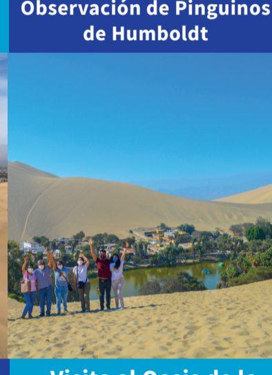
Visita al Oasis de la Huacachina