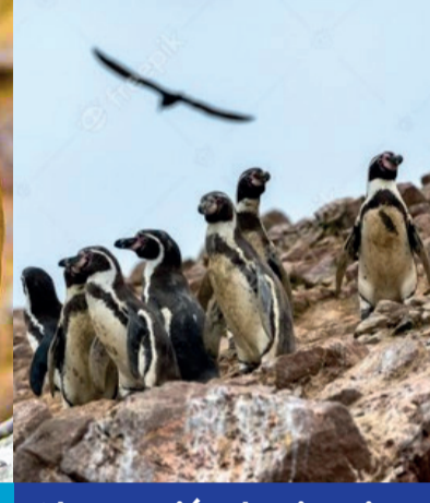
Observación de Pinguinos de Humboldt