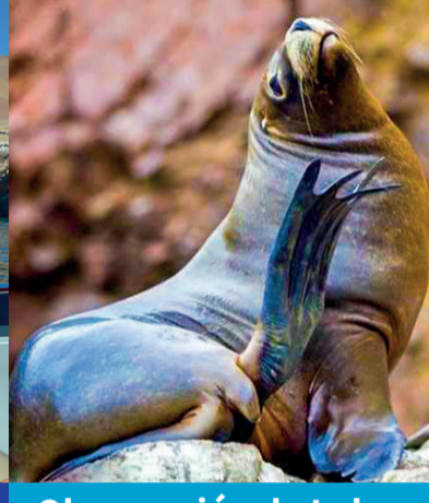
Observación de Lobos marinos