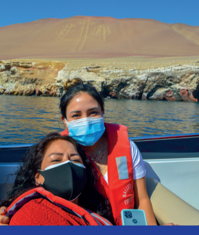
Vista al Candelabro