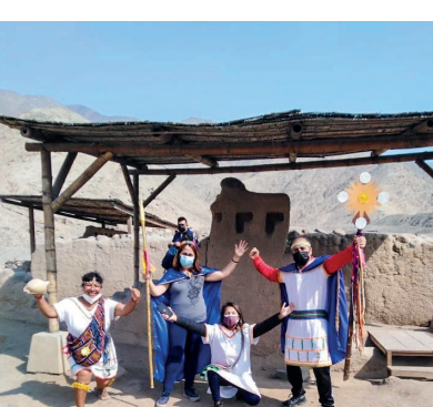
Visita a Zona arqueológica