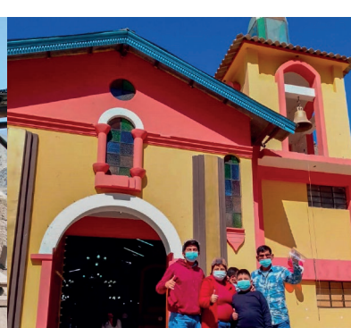
Visita al pueblo de Sisicaya